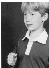
Tableau de lecture